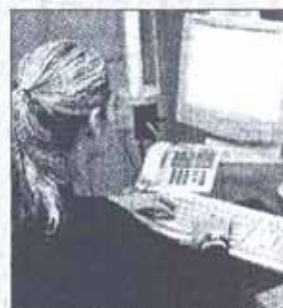
Una navigatrice nel web